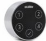
(B) Burg Intro.Code