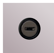
(J) Lehmann mechanical lock