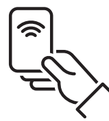
(R) Lehmann M410.RFID

(J) Mechanical lock, (Z) Mechanical code bolt lock, (B) Electronic code lock, (E) Electronic RFID lock, (C) Electronic code lock, (F) Electronic code lock with RFID card, (R) Hidden electronic RFID lock with visual signalling.