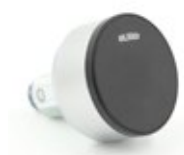
(E) Burg Intro.RFID